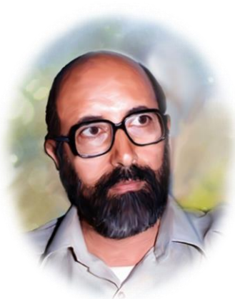
شهید دکتر مصطفی چمران

عضو هیات علمی دانشکده الهیات و معارف اسلامی