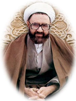
استاد شهید مرتضی مطهری

تعداد شهدای دانشجو ۳۶۸ نفر و تعداد شهدای کارمند ۲۲ نفر و ۵ شهید نیز از اعضای هیأت علمی دانشگاه می‌باشند.